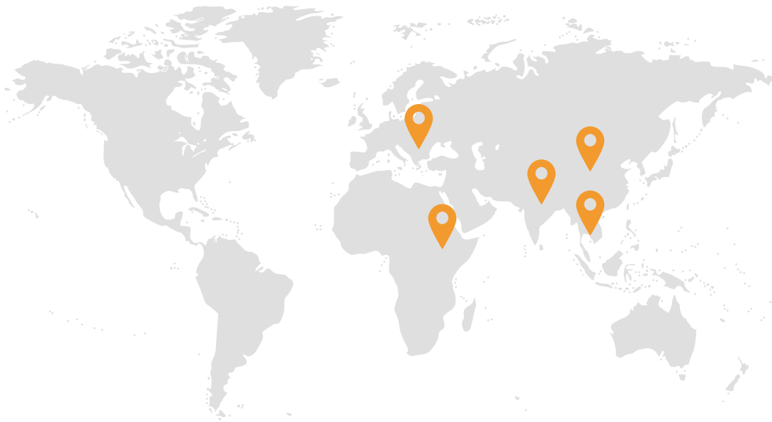
Wo wir English Lessons geben

Seit dem ersten Tag geben unsere Freiwilligen jede Woche Englischunterricht in verschiedenen Ländern dieser Welt und so kommt es, dass wir bereits über 400 Englischstunden gegeben und über 1000 Kinder durch unsere Projekte erreichen konnten.